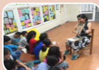
藝術家教師教導如何利用回收物進行再利用教學