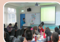
Tango 課程教學成果發表