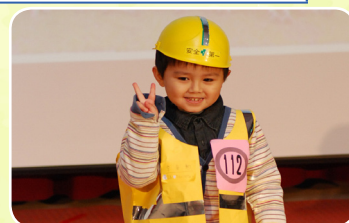
創意碳工造型走秀