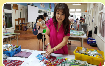
校長也參與學釘畫