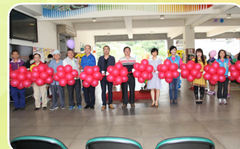
碳狗公共藝術揭幕