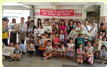
大手牽小手藝術來傳家