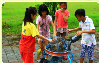
小朋友和碳狗共同嬉戲