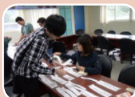
教授實際帶領教師如何討論與分組