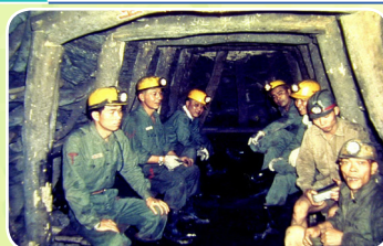
礦工在斜坑底休息