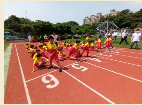
環狀操場跑道(6線道)